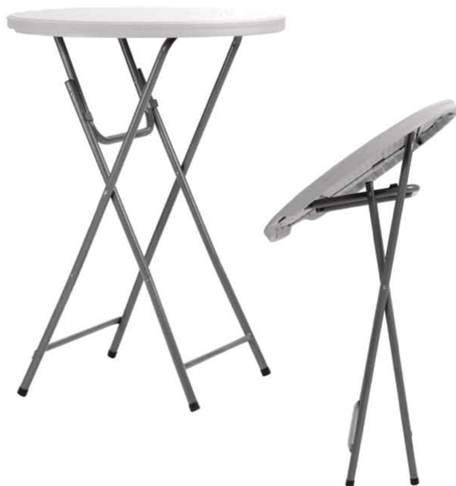
Table pliante mange-debout rond en polyéthylène