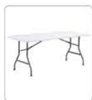
Table 153 PEHD

Aussi disponible en différentes tailles :