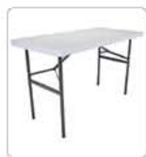
Table 122 PEHD